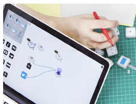
Práce s počítačem

SAM Labs náměty hodin byly vytvořeny učiteli pro učitele v rámci anglického kurikula. Jsou jasné a intuitivní a mohou být inspirací pro vaše vlastní aktivity.