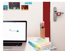
Design a technologie